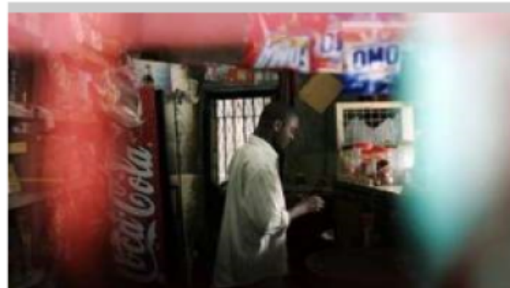
Lait en poudre à la mélamine vendu en Afrique